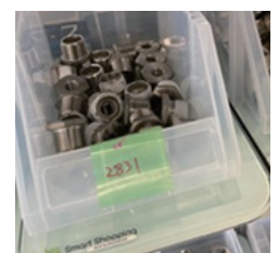
製造 ネジ・ボルト